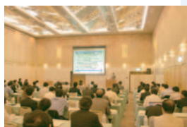
TOPPERSカンファレンス 2005の様子

TOPPERSプロジェクトでは会員の皆様、TOPPERSにご興味をお持ちの方々にプロジェクトの成果や会員が関係する技術・商品・普及活動の最新動向をお知らせする場として「TOPPERSカンファレンス」を毎年開催しています。